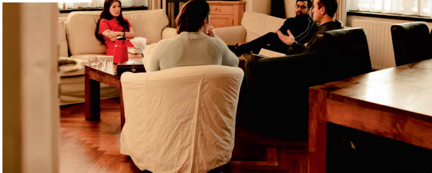
Foto: Broeder John met een kleine groep jongeren die zich voorbereiden om Katholiek te worden.

In de 10 jaar dat ik hier in Utrecht op missie ben onder studenten en jongwerkenden heb ik gezien hoe belangrijk het is voor jonge mensen in deze fase van hun leven om de mogelijkheid te hebben samen te komen en stappen te zetten in het vormgeven van hun leven. Hierin verschilt het sterk van de missie onder tieners. Jongvolwassenen zijn op een moment in hun leven waarin de keuzes die zij maken bepalend zijn voor de rest van hun leven. Voor die keuzes is leren, zoeken, bidden, advies en begeleiding, en de steun en bemoediging van vrienden nodig. De broeders achten het een voorrecht om dat te kunnen bieden. Het vervult ons met blijvende vreugde de jonge generatie te zien groeien in hun geloof. Meerdere bewoners hebben hier een roeping tot het priesterschap of tot het religieuze leven ontvangen, en andere hebben hier hun wederhelft gevonden. Het is prachtig om de Kerk op deze manier te zien groeien en vernieuwd te zien worden. Hoewel niet elke bewoner zijn specifieke roeping hier ervaart, is het een omgeving die de middelen biedt voor het maken van een goede onderscheiding. De studenten, jongwerkenden, broeders en parochianen zien het ook als onderdeel van onze missie om steun te bieden aan wie een moeilijke tijd doormaakt. Het is ontroerend om te zien hoe vrienden en een thuis ons kunnen helpen om ons tot God te keren, ons door de moeilijkheden van dit leven kunnen leiden en ons kunnen helpen de genezing en groei te ontvangen die wij nodig hebben.