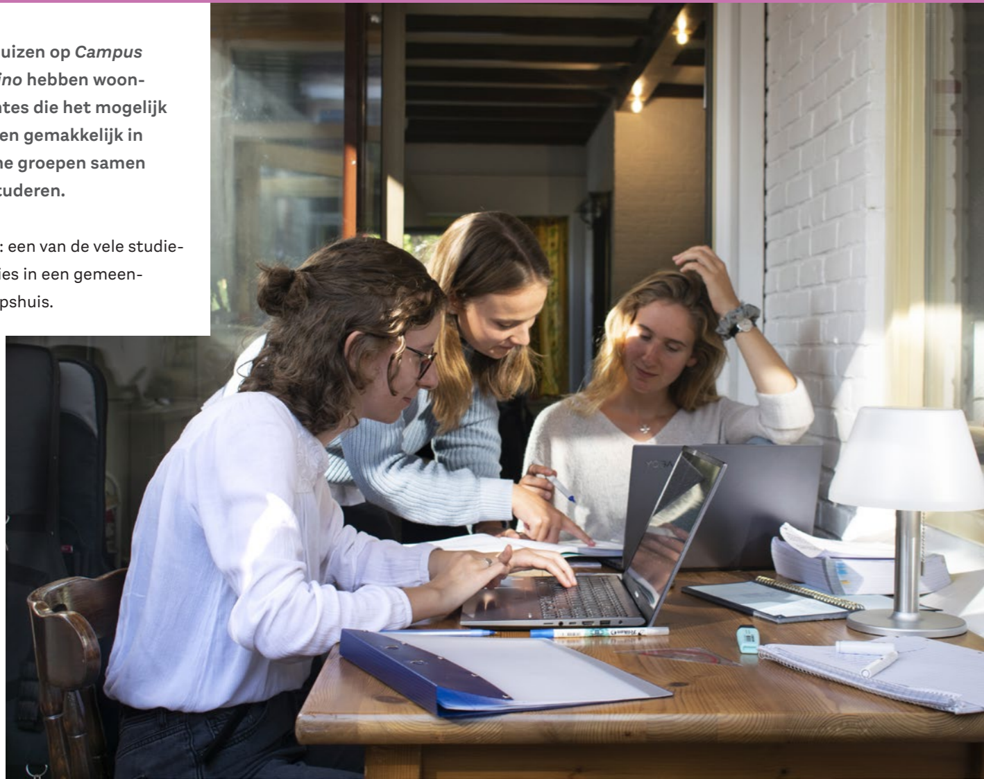
Foto: een van de vele studiesessies in een gemeenschapshuis.

Het leven in de studentengemeenschap heeft veel voordelen. Naast de verrijkende vriendschappen, de geloofsvorming en de ruimte voor persoonlijke groei biedt de gemeenschap ook een stimulerende omgeving voor studie. Onze studies nemen het grootste deel van onze tijd in beslag. We delen met elkaar het plezier en het enthousiasme, maar ook de moeilijkheden van de cursussen die wij volgen. Dat wij dit samen kunnen doen geeft veel motivatie, omdat je weet dat je er nooit alleen voor staat! Wij organiseren vaak gezamenlijke studiesessies waarin wij elkaar helpen erdoorheen te komen. Naast het studeren, dat een centrale rol inneemt in ons leven hier, praten wij over en bidden wij voor goede toekomstkeuzes, masteropties of carrièremogelijkheden. Door met elkaar te delen wat wij aan het doen zijn scheppen wij sterke vriendschapsbanden. En door elkaars perspectief aan te horen kunnen wij dat meenemen in onze eigen onderscheiding. De gemeenschap helpt je dus om te ontdekken waartoe je bent geroepen, met al je talenten en kwaliteiten. Om daar een voorbeeld van te geven: het is mij door de gesprekken met anderen hier en door gebed duidelijk geworden dat ik heel graag het onderwijs in zou willen! Ik ervaar dit sterk als mijn persoonlijke roeping. Kortgezegd biedt Campus Aquino je veel steun bij je studie, en is het een motiverende en vormende omgeving die sterk bijdraagt aan een geweldige tijd aan de universiteit!