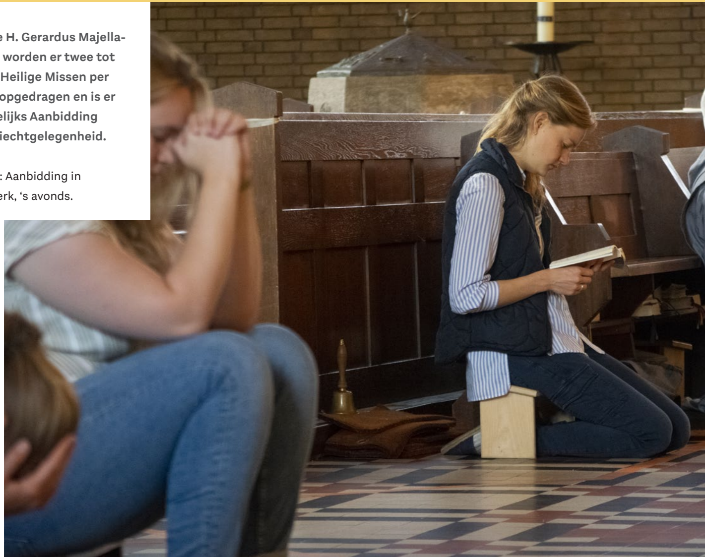
Foto: Aanbedding in de kerk, 's avonds.

In mijn tijd op Campus Aquino heb ik Gods liefde leren kennen en heb ik gezien hoe die liefde gedeeld wordt onder alle mensen om ons heen: van een warm "Goedemorgen!" dat ik altijd kreeg van mijn huisgenoten tot het bidden voor de maaltijden, en de bijeenkomsten om te praten over God, het leven, muziek en de zorgen die ons bezighouden, en die dikwijls eindigden in gebed voor elkaar. De maaltijden met de broeders, leren hoe je met heel je hart een volgeling van Jezus kunt worden, het voorbeeld van de broeders en de andere studenten en jongwerkers. Het wonen in een geloofsgemeenschap is een van de beste manieren om Gods liefde te ervaren! Ik zal de momenten van lofprijzing, het leren spelen van nieuwe instrumenten met de hulp van mijn huisgenoten en vrienden en de gezellige bordspelavonden blijven koesteren. In al deze momenten is Jezus bij ons geweest om ons hart tot het Zijne te brengen door gebed, delen en plezier!