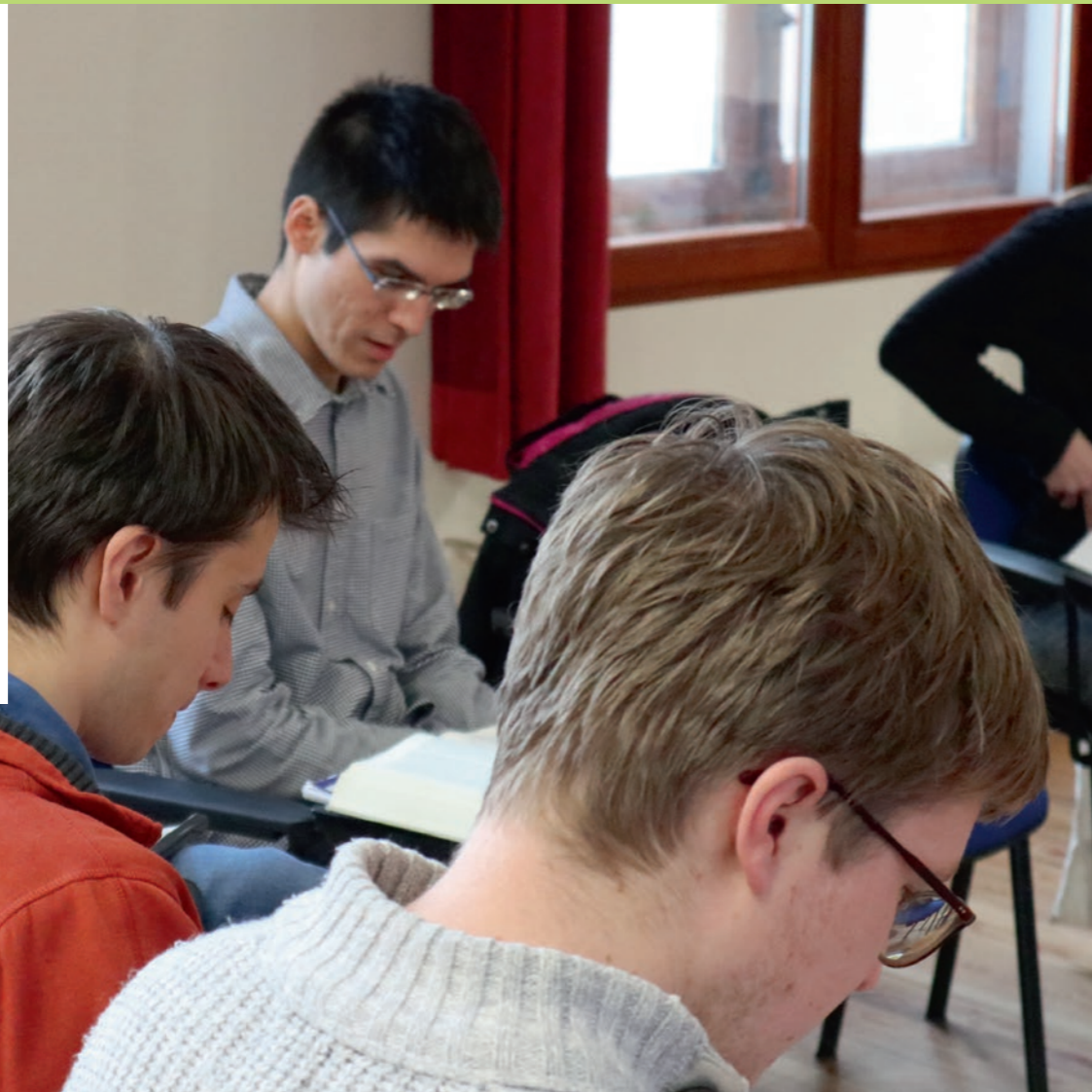
Foto: deelnemers tijdens een Adventsretraite georganiseerd door Katholieke Studenten Utrecht en gegeven door een van de Zusters van Sint Jan.

Ik woon met veel genoegens sinds afgelopen zomer tegenover de H. Gerardus Majellakerk. Dat genoegens heeft drie redenen. Ten eerste spoort het mij aan om regelmatig naar de Heilige Mis en naar de stille Eucharistische Aanbidding te gaan—twee dingen die naar mijn ervaring zeer voedzaam zijn voor het innerlijk leven. Het is erg behulpzaam dat dit alles 50 meter van mijn huis beschikbaar is. Ten tweede denk ik dat het erg belangrijk is om onderdeel te zijn van een geloofsgemeenschap. Het geloof is iets dat je samen met anderen leeft. Het sociale contact en het delen binnen de gemeenschap zijn zeer waardevol. Ten derde voel ik mij aangetrokken tot de spiritualiteit van de broeders. De zoektocht naar waarheid raakt mij en heeft mij veel inzichten gebracht, in het bijzonder over hoe ons verstand door God gegeven is en ons kan helpen de werkelijkheid steeds dieper te begrijpen. Ik denk dat iedereen op zoek is naar wat echt en waar is. Door dit zoeken naar waarheid zijn de broeders goed in staat de vragen van mensen in deze tijd te verstaan.